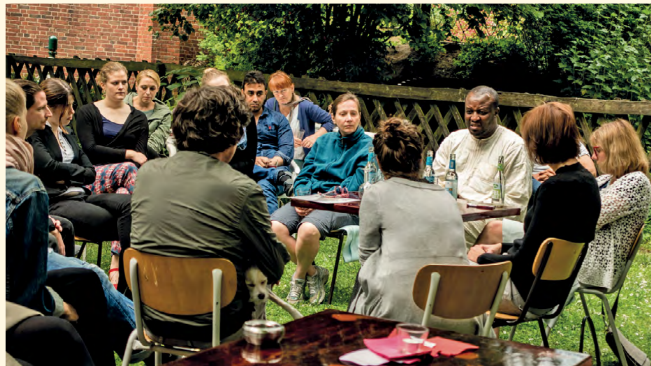
Begegnung im kirchlichen Kulturprojekt Hamburg-Veddel (s. Seite S. 10)