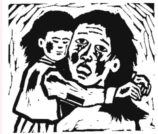
Hong, Sung-Dam: Die kanaanäische Frau, Holzschnitt aus Korea