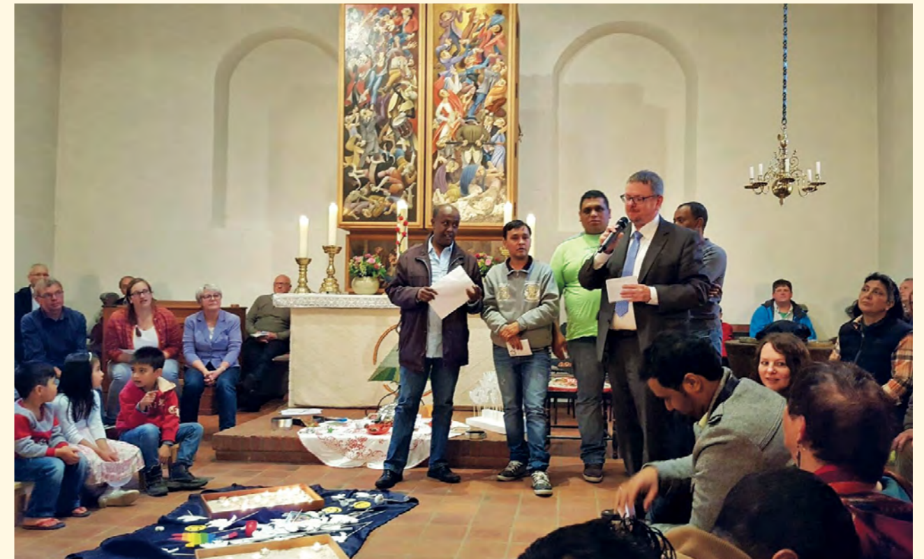
Interkulturelles Friedensgebet in der St.-Willehad-Kirche zu Leck (s. Seite 48)

Apg 11, 19-26 ist – was die Grenzüberschreitung der Evangeliumsverkündigung und die nachfolgende Lebensgemeinschaft von Juden mit vormaligen Polytheisten verschiedenster kultureller Herkunft anbetrifft – von wegweisender Bedeutung für die weitere Entwicklung des Frühchristentums: 7 Lukas erzählt davon, dass einige von denen, die Jerusalem wegen der Verfolgung, die mit der Ermordung des Stephanus angehoben hatte, verlassen mussten, nach Phönizien, Zypern und Antiochia emigrierten, wobei sie zunächst noch „das Wort ausschließlich Juden verkündeten“ (11, 19). Einige von diesen jü-